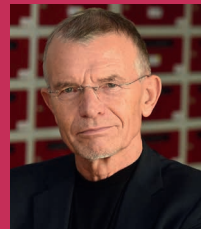
Prof. Dr. Klaus Hurrelmann